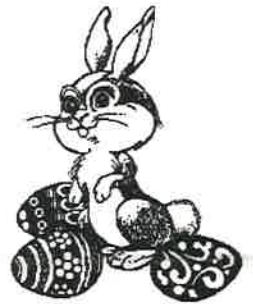
Danielle Chabot collectionneuse de lapins

Musée de la Civilisation, les 1 er et 2 avril jusqu'à Pâques.