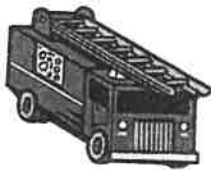
Schéma de risque incendie

Nous vous rappelons que les feux à découvert dans un endroit privé sans autorisation sont prohibés, sauf s'il s'agit d'un feu de bois allumé dans un foyer spécialement conçu à cet effet. De plus, assurez-vous de ne pas déranger vos voisins avec votre fumée.