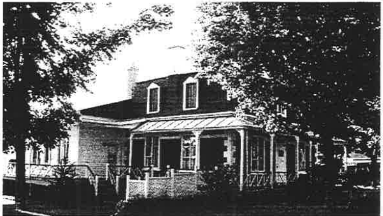
Maison Dussault / Grégoire